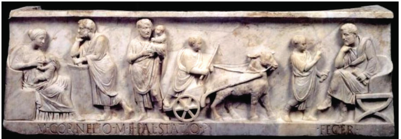
Picture 1 Stages in growing-up, illustrated on a sarcophagus

Candidates should study the following pictures, one or more of which will be used as a basis for questions in each question paper.